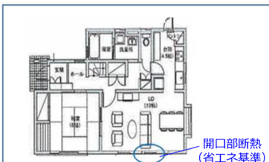
住宅の一部の断熱改修イメージ図 (①-イの基準に適合)

太陽光発電設備、太陽熱利用設備、高断熱浴槽、高効率給湯機、またはコージェネレーション設備の いずれかの設備 を設置する工事